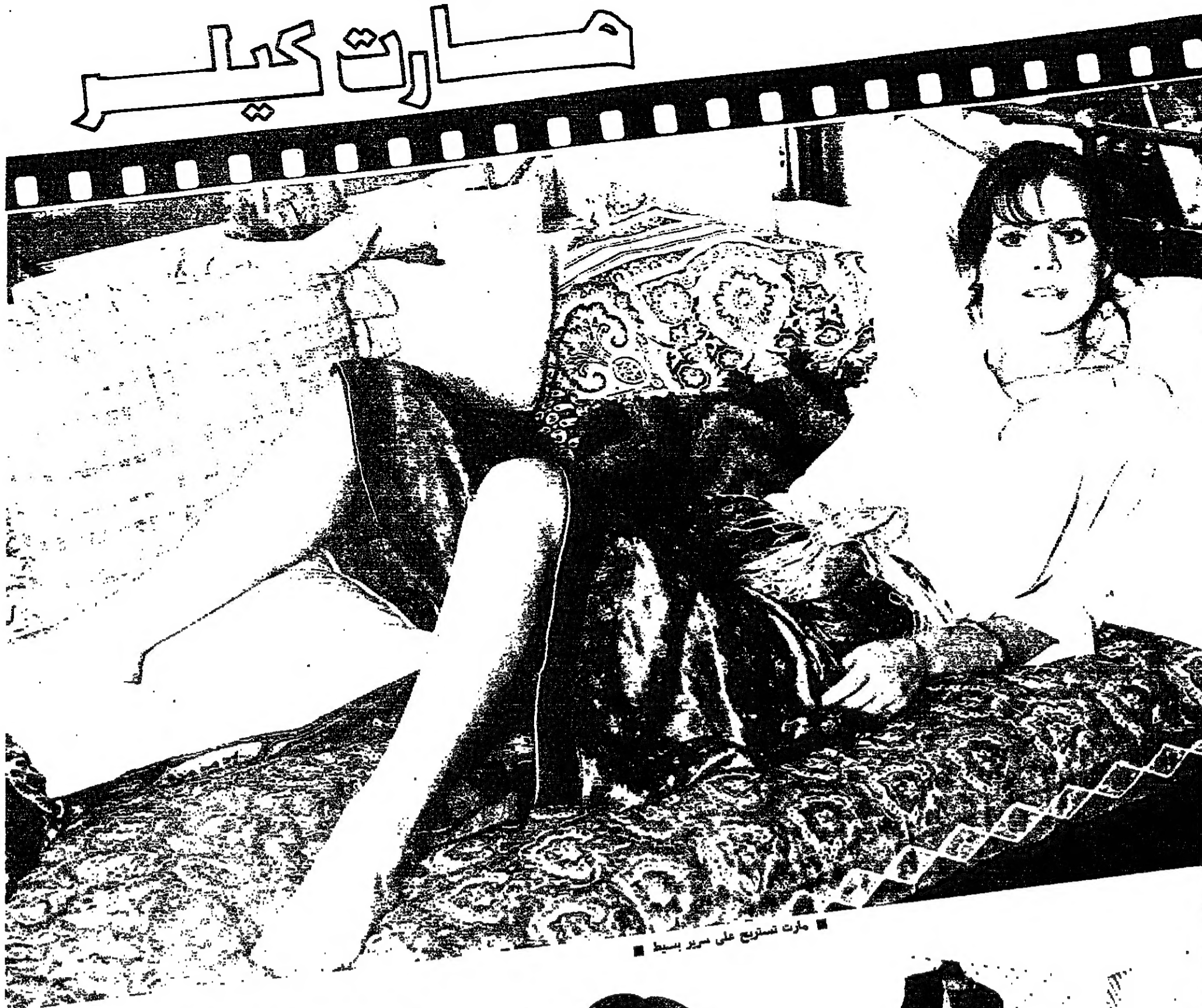
مارت تستريح على سرير بسيط